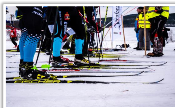
Startplatsen 41 km

Starttid: 11:00 både 41 och 15 km Köldgräns: -20 vuxen (21 år) -17 Juniorer Målgång: Viksmon 262 för båda loppen Dusch/ombyte: Grångebyn ingång på kortsidan mot parkering Boende: För boende www.graningeffc.se Prispengar 41 km 1:a 4000 kr (D & H) 2:a 2000 kr (D & H) 3:a 1000 kr (D & H) Prispengar 15 km 1:a 1500 kr (D & H) 2:a 1000 kr (D & H) 3:a 500 kr (D & H) Prisutdelning: ca 30 minuter efter första målgång Varupriser: Lottas ut på startnummer i respektive klass